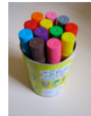
un pot de feutres